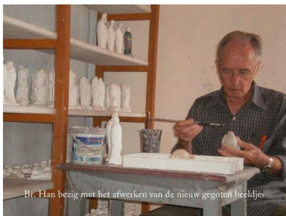
Br. Han bezig met het afwerken van de nieuw gegoten beeldjes

25-7: Dit maal een probleem bij Kapare, de unit waar de gipsen kerstgroepen worden gemaakt. De man die daar de leiding had heeft ontslag genomen. Op zich niet zo'n probleem, maar ik heb geen ander. Bovendien is er nog maar één jongen die regelmatig kwam schilderen. Ik zal er zelf voor