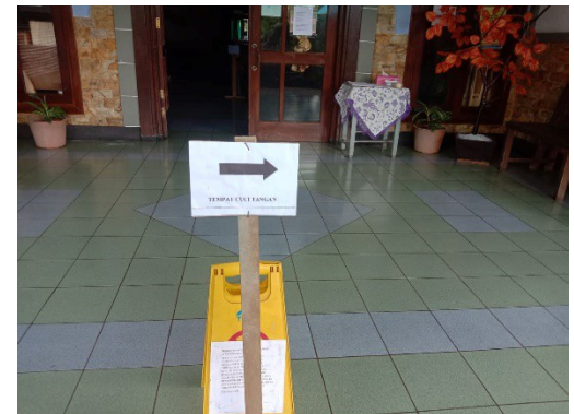
“tempat cuci tangan” handen wassen

1. Vanaf het moment dat wij via Facebook informatie rondstuurden dat Sayap Kasih weer open ging voor bezoekers, is het aantal bezoekers weer aan het toenemen. Deze bezoekers moeten zich houden aan de duidelijke instructies van de overheid: Handenwassen, Mondkapje dragen en 1½ meter afstand houden.