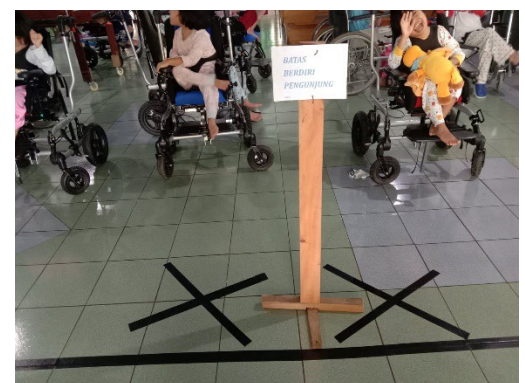
de grens tussen bezoekers en kinderen, duidelijk aangegeven limiet!